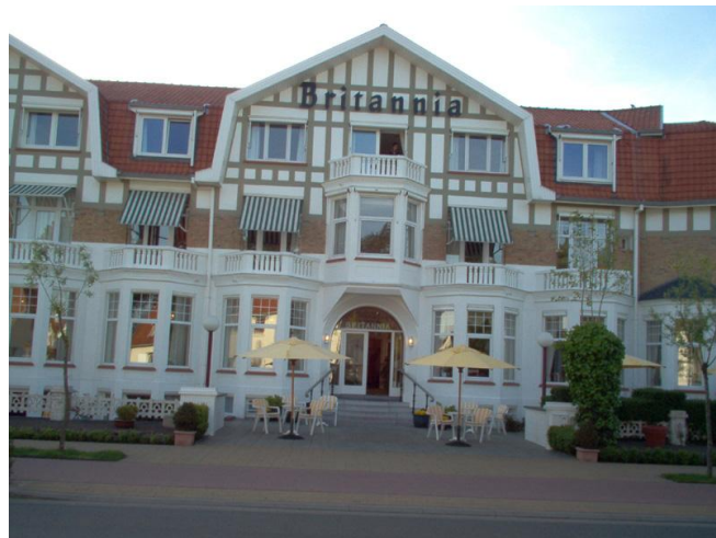
Hotel Britannia, unsere Unterkunft