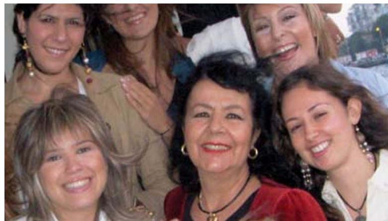
... bei der Gründung von BPW Istanbul ...