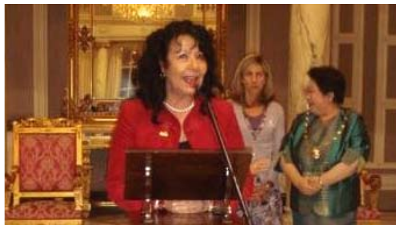
... bei einer Tagung in Valencia