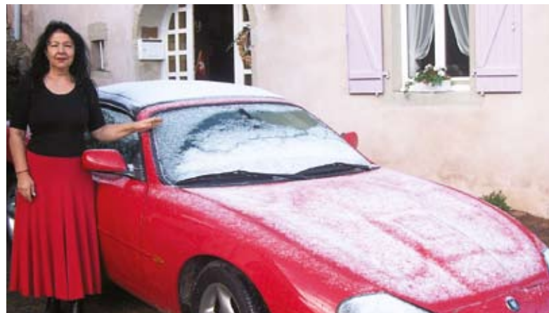
Ihr „Angelo Rosso“ ein rotes Jaguar Cabriolet kurz vor dem Winterschlaf

NEFU ist Das Netzwerk der Einfrau-Unternehmerinnen und existiert seit 1993. Heute gehören dem losen Netzwerkbund 1500 Frauen an. www.nefu.ch